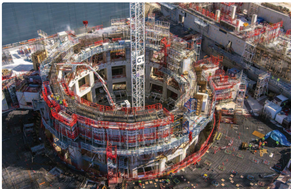
L'enceinte du tokamak du projet ITER en construction.

Le Conseil ITER est l'organe de gouvernance de l'Organisation ITER. Il se compose de représentants de chacun des membres de l'Organisation ITER. ●