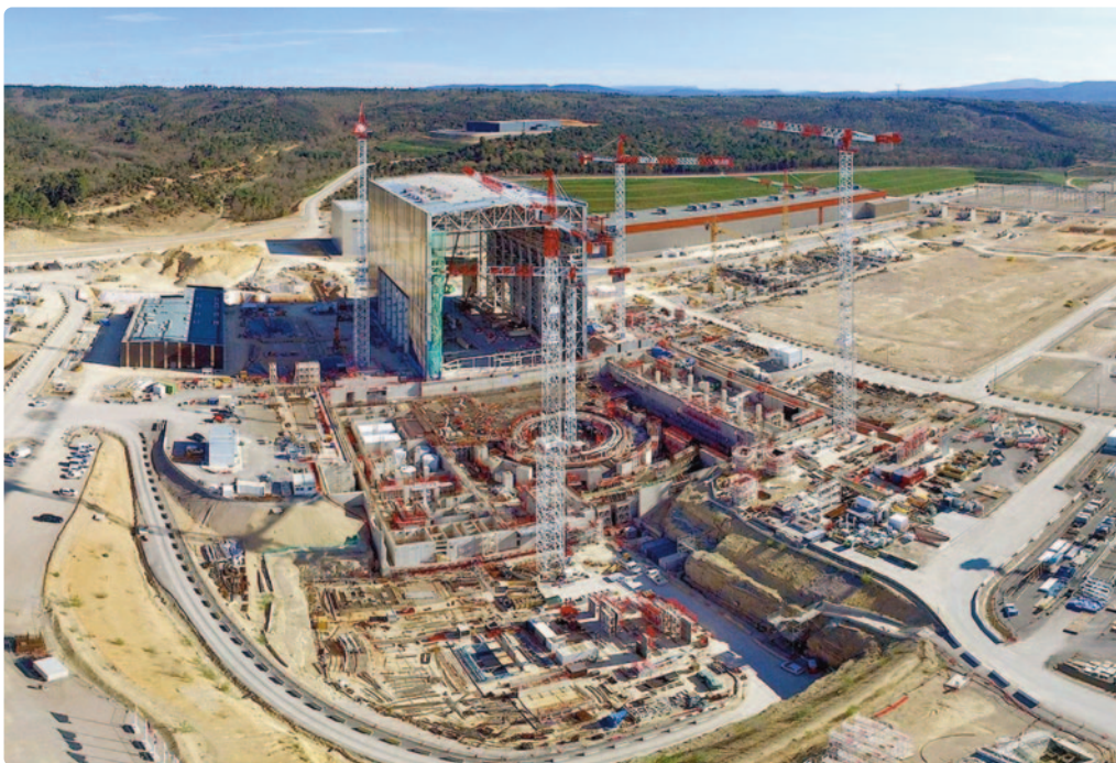
Le chantier du projet ITER à Saint-Paul-lez-Durance dans les Bouches-du-Rhône (état en avril 2016).

L'Europe et la Chine ont récemment célébré la fin des travaux de la première des bobines de champ poloïdal (PF), tandis qu'une autre bobine PF, fabriquée sur site, sera prête