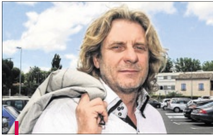
Sans surprise, le maire sortant a été élu lors du conseil municipal de vendredi dernier.