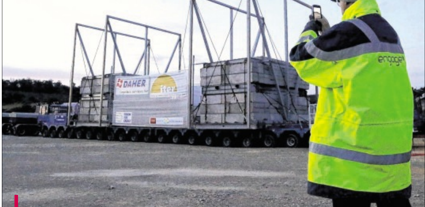
Le soleil se lève sur le chantier Iter, la maquette est arrivée à bon port. Il faudra deux jours pour la démonter.

Hier matin, le test de convoi s'est achevé en avance