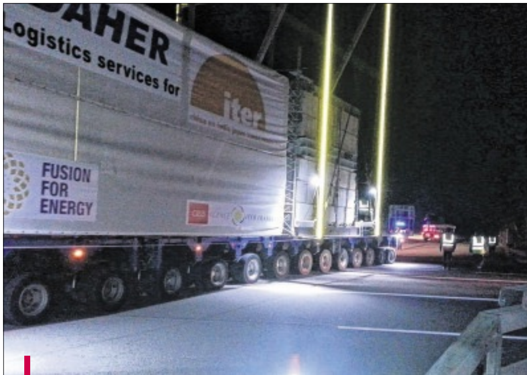
Abordé sans difficulté, le franchissement de l'A51 à Mirabeau est l'un des seuls obstacles du tronçon Meyrargues-Cadarache.