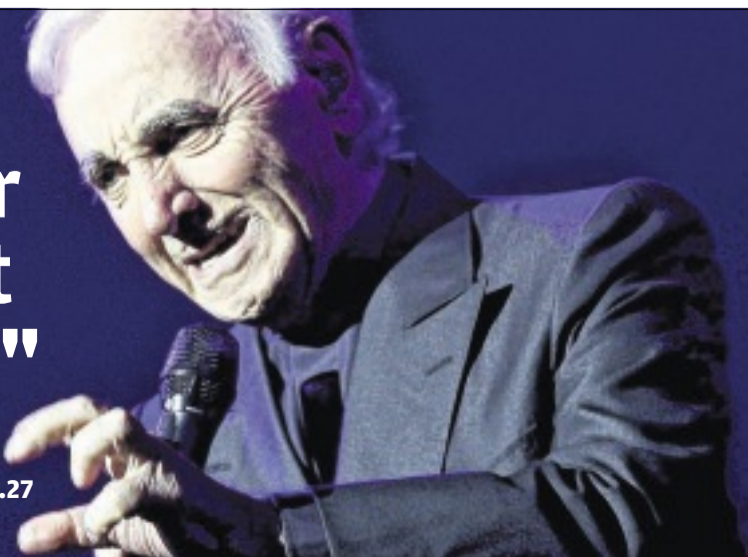
P.27