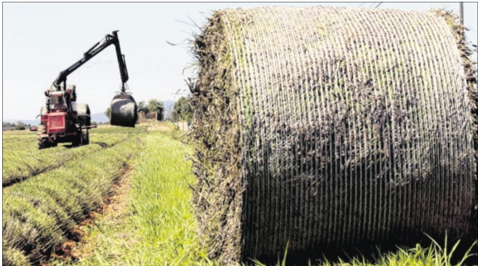
La Société d'aménagement foncier et d'établissement rural (Safer) des Alpes-de-Haute-Provence se félicite d'un bilan 2014 plutôt satisfaisant. Le nombre d'acquisitions et de candidatures au rachat de terres agricoles est en augmentation. P.3