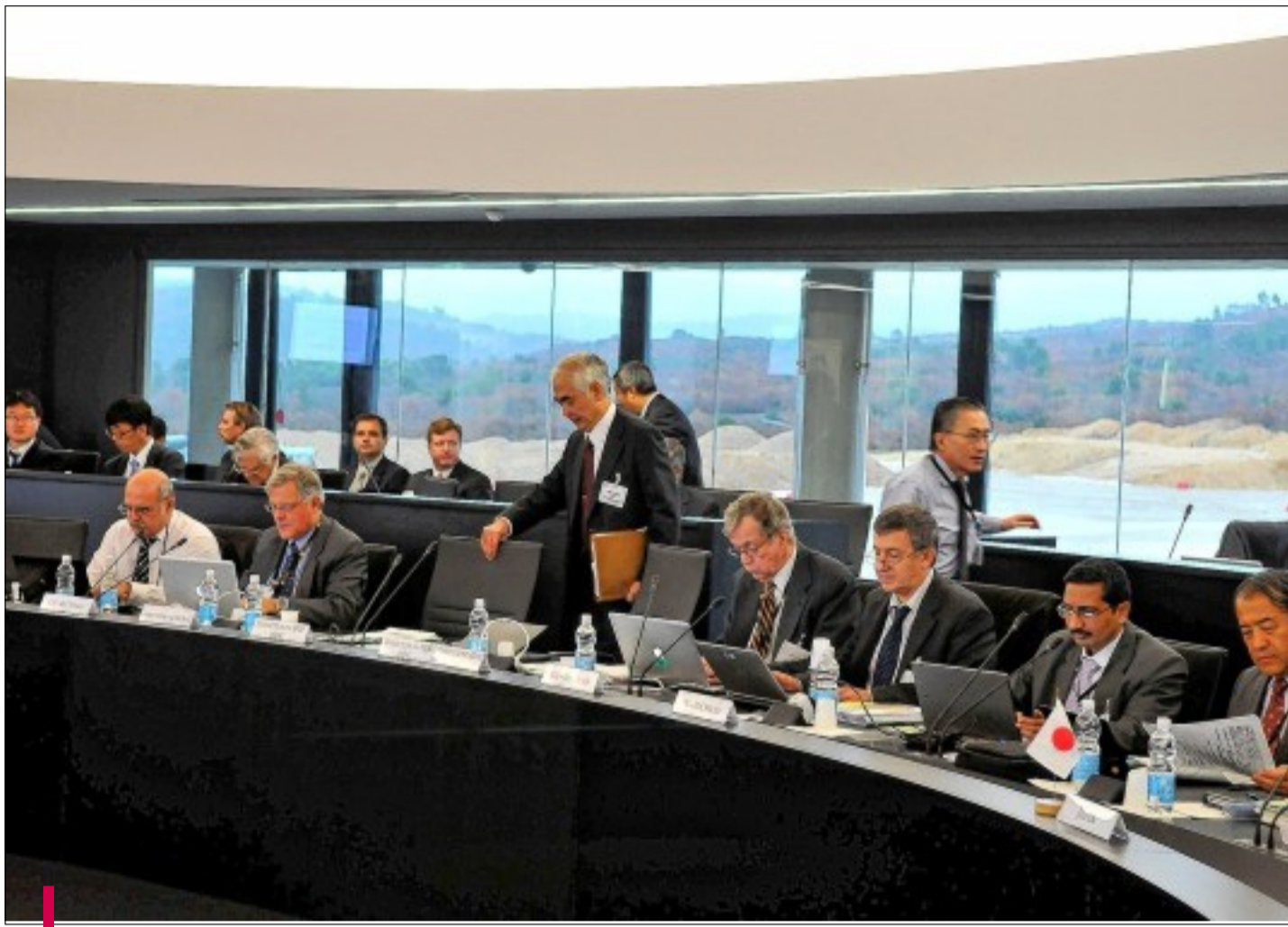
Mercredi et jeudi, le 11 e conseil Iter s'est tenu pour la première fois dans cette salle, spécialement conçue à cette fin.

Constat identique pour la fabrication des éléments du tokamak. "La réunion a été l'occasion de présenter l'état d'avancement des accords de fourniture, dont 80 ont été signés à ce jour; ce qui représente 81,2% de la valeur totale